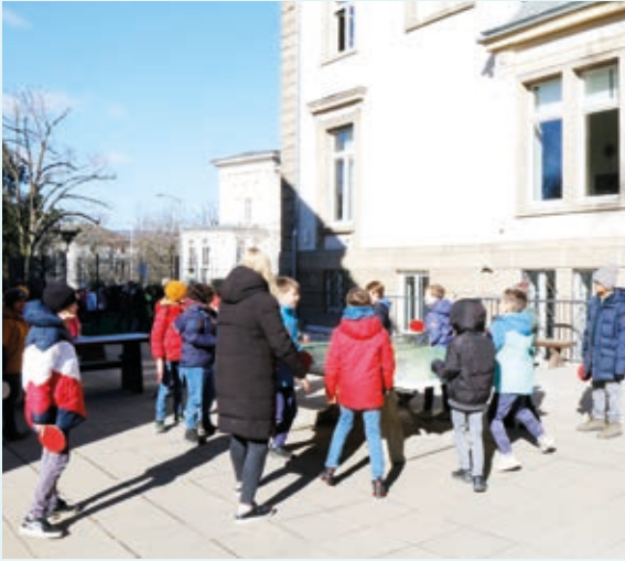
Tischtennispiel im Innenhof der Bierstadter Straße 15