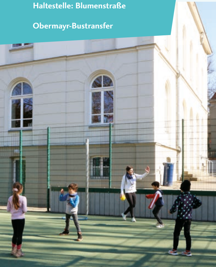
Bierstadter Straße 13: Kunstrasen-Sportplatz