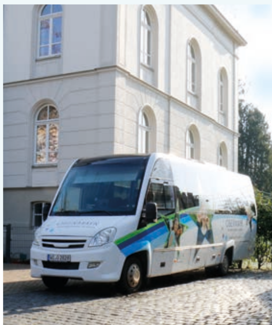
Eigener Bus »EDUAKTIV« für Ausflug- und Transferfahrten