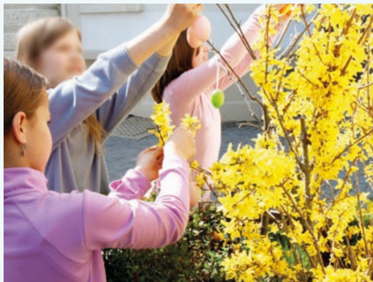
Schülerinnen der 3. und 4. Klasse schmücken die Schule