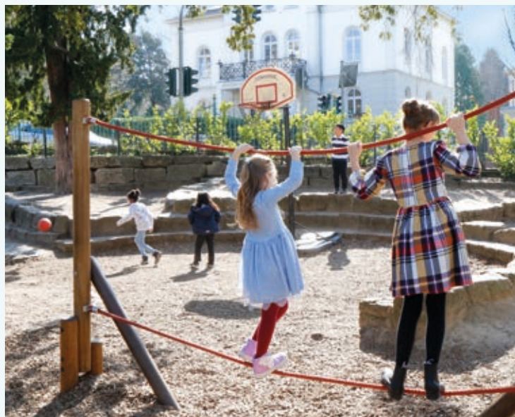
Bierstadter Straße 14: Spielplatz mit Blick auf die B13